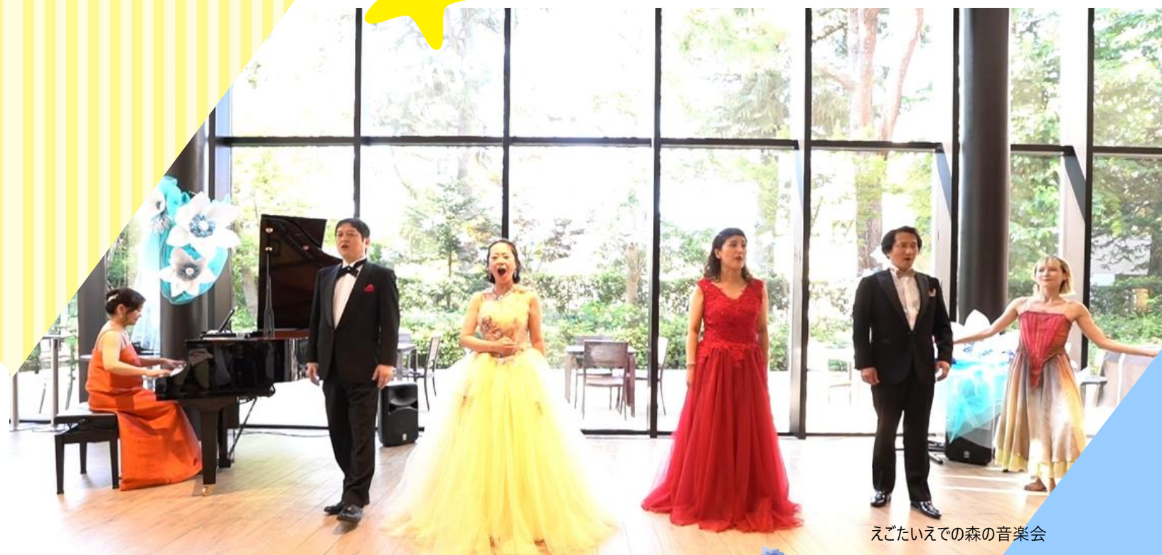
えごたいえでの森の音楽会