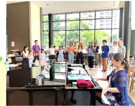
森のファミリー合唱団