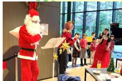
森の音楽会クリスマス