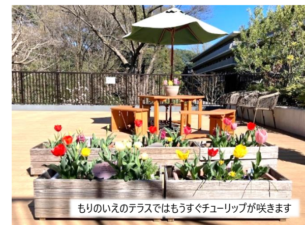
もりのいえのテラスではもうすぐチューリップが咲きます