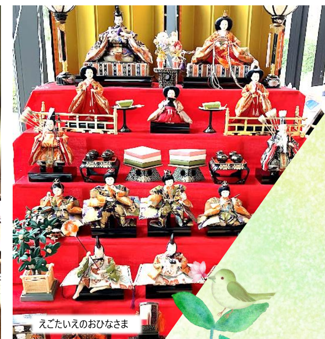
えごたいえのおひなさま

能登半島地震から 2 か月、被災された方、お身内やお友達のいらっしゃる方、心より お見舞い申し上げます。それでも春はめぐってきます。あちらから、こちらから、春の足音が 聞こえ始めました。江古田の杜の入り口には、もう河津桜が咲いています。 春の風と光を浴びて、江古田の森公園を散策しましょうか、花粉症の方は気を付けて・・・