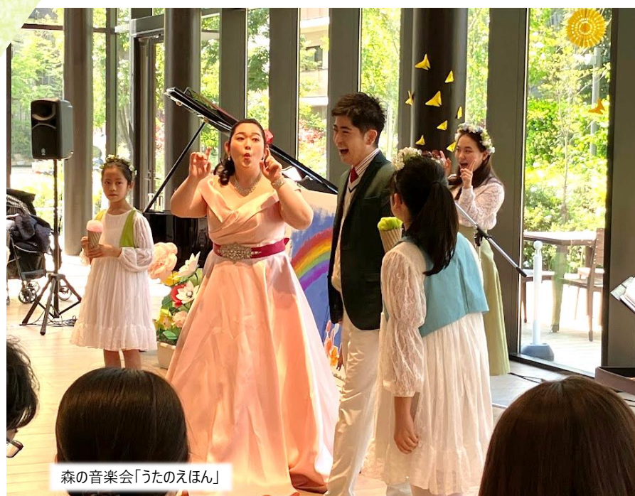
森の音楽会「うたのえほん」