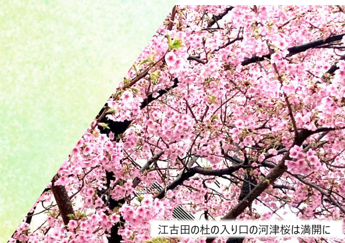
江古田の杜の入り口の河津桜は満開に