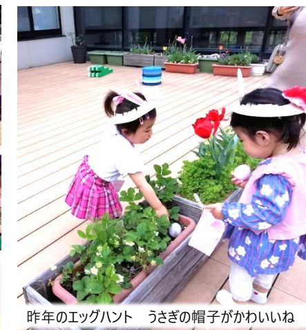
今年のエッグハント うさぎの帽子がかわいいね