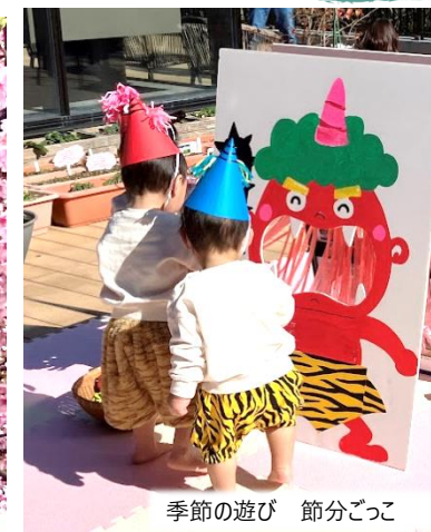
季節の遊び 節分ごっこ